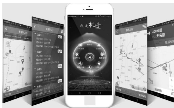
图3 机手手机 App 部分界面图

智慧农机项目集成了云计算、物联网、移动互联网、大数据分析等技术，是“互联网+”现代农业及“大智移云”在农业领域的典型应用，实现了农机信息自动获取、农机作业智能管理、农机管理作业智能决策。