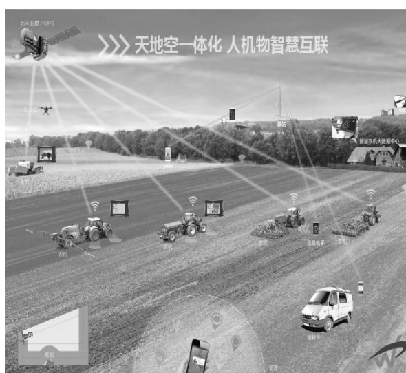
图1 智慧农机部署图

智慧农机项目是由河北省农机局、农机监理总站发起,河北农业大学河北农业大数据协同创新中心、保定天河电子技术有限